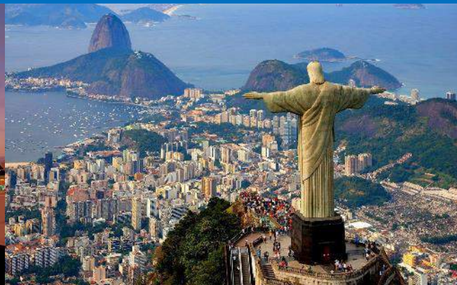
RIO DE JANEIRO 02 e 03 de junho